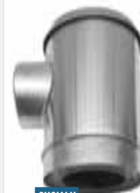
Té souche insonorisé